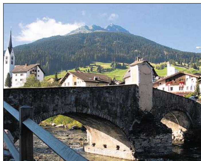
La fusiun instradada en Surses cumpeggia 9 vischnancas.